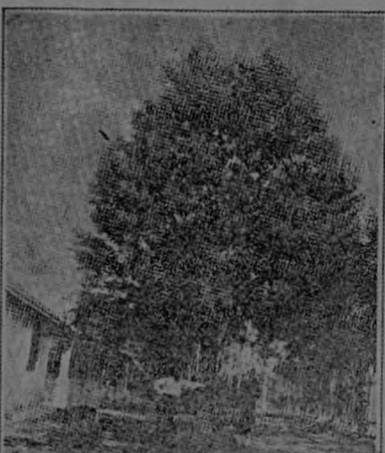
ARBOL DE 2 AÑOS - Altura 8 mts. CENTRO COMERCIAL SAN JOSE, C.R. Apartado 614.